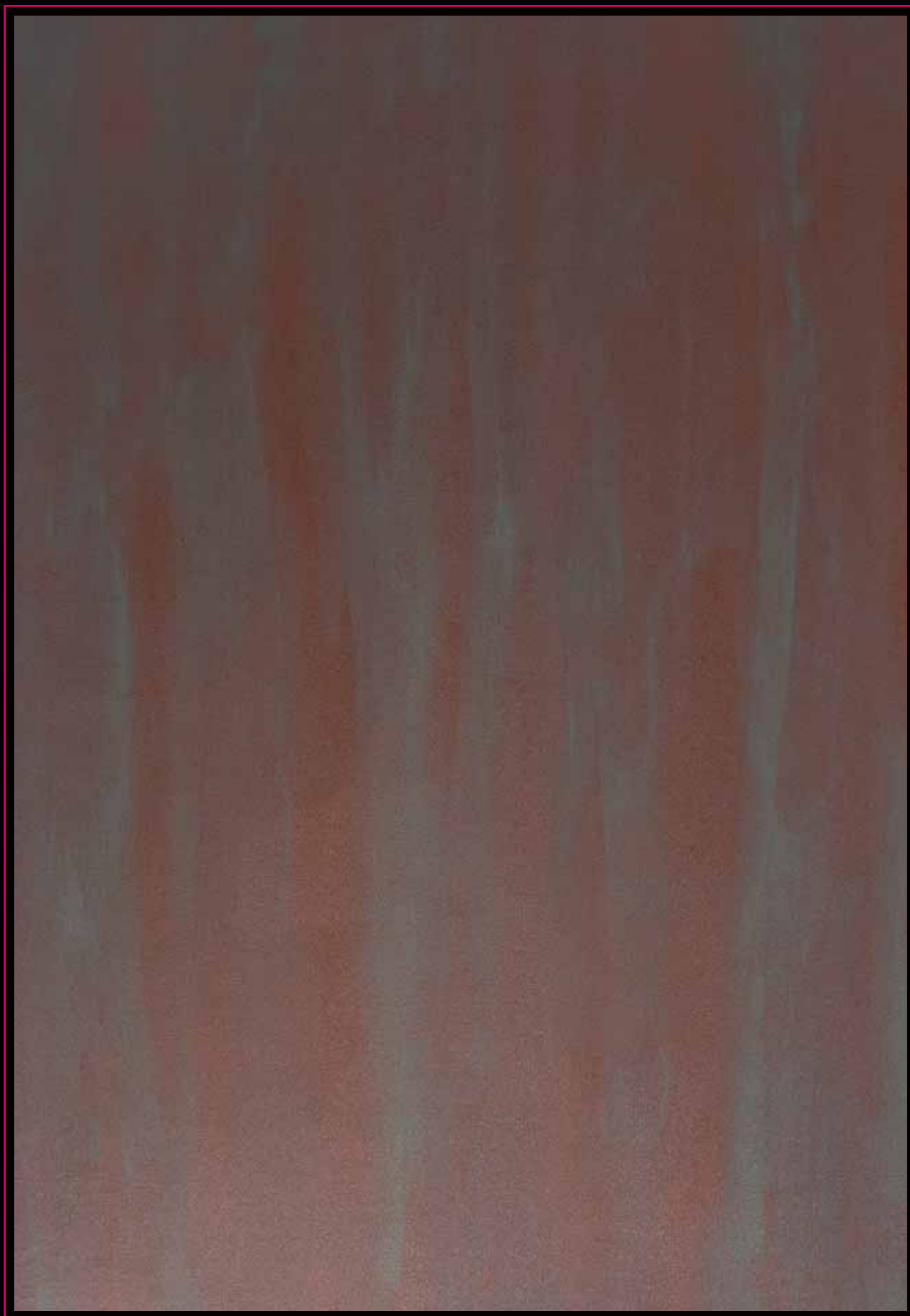
Antico Ferro Ossidato

Supercolor N 128 + Novalis Ferromicaceo NF 2110 +Novalis Smalto Opaco B 275