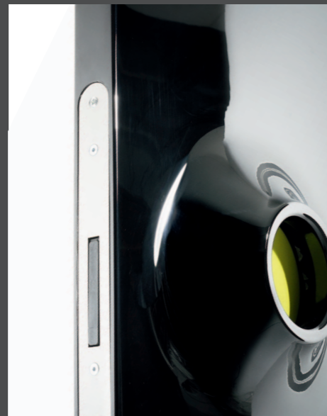
Particolare maniglia Detail of the handle Détail de la poignée Detail des Griffes Detalle del tirador