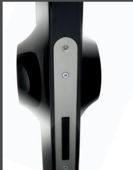
Particolare serratura magnetica Detail of the magnetic lock Détail de la serrure magnétique Detail des magnetischen Schloß Detalle de la cerradura magnética