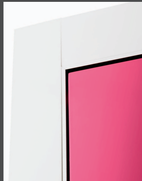
Particolare coprifili personalizzabili Detail of the finishing lists Détail des caches personnalisés Detail der Verkleidungen Detalle de las tapajuntas personalizables